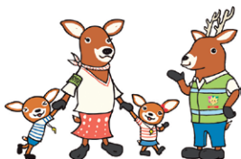
「減らそう犯罪」マスコットキャラクター「モシカ」

犯罪者は犯行に手間や時間がかかることをきらいます。少しの外出や駐輪の時もしっかり鍵をかける、鍵を2個付けるなどして、大切な財産を守りましょう。