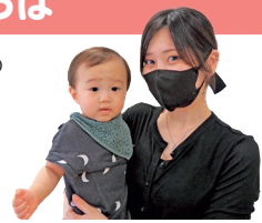
琉叶くん(11カ月)とお母さん