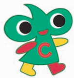
中区のまちづくりの マスコットキャラクター 「なかちゃん」