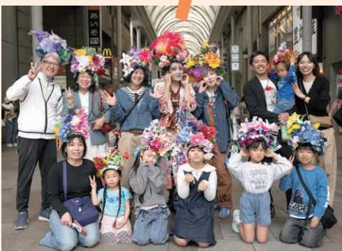
ヘッドドレスワークショップに参加した皆さん

袋町地区では、LMOと本通商店街が 力を合わせたイベントにより、地域 のにぎわいづくりに取り組んでいます。 地域をよく知るLMOと、人を呼び込む力 を持つ商店街。それぞれの強みが重なる ことで、新しい出会いや交流が生まれ、 「また来たい」「関わりたい」と思える地 域づくりを目指します。