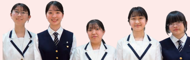
ロゴマークを制作した安田女子高等学校の皆さん

ロゴマークを制作するために白島を調べる中で、毎年お祭りが開か れていることや、人とのつながりを大切にすまちなことを知り ました。交通の便利さと自然の豊かさという魅力にも改めて気づき、 普段気にしていなかったまちの景色にも自然と目が向くようになりま した。白島への愛情が芽生え、今度はお祭りにも参加してみたいです。