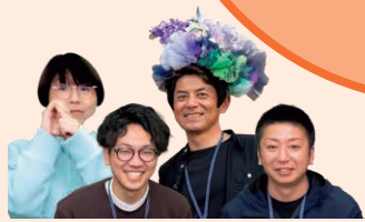
広島本通商店街振興組合の皆さん

LMOと連携することで、物 品の貸出や設営、広報などの協 力が得られ、イベント開催の負 担が大きく軽減されました。連 携を続けて取り組みが定着す れば、参加の輪や新たな挑戦が 広がっていくと感じています。 地域とのつながりも、LMOの おかげでぐっと身近に感じら れるようになりました。