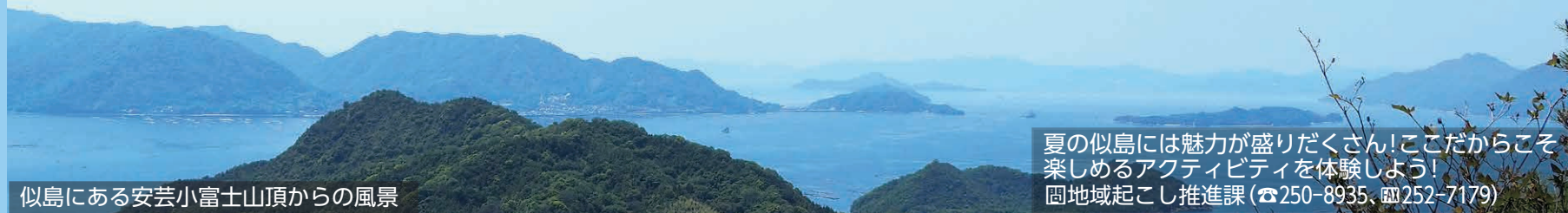
似島にある安芸小富士山頂からの風景

夏の似島には魅力が盛りだくさん!ここだからこそ楽しめるアクティビティを体験しよう! 岡地域起こし推進課 (☎250-8935、☎252-7179)