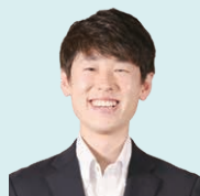
高齢福祉課 三島主事