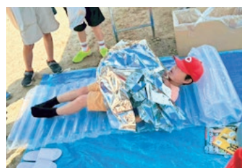
▲エアーマットと保温シートを使って寝る体験