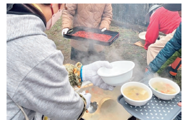
▲豚汁の炊き出し訓練

山城町内会では、補助金で材料を整え、炊き出し訓練をしたり、折り畳み式担架を住民の皆で使ってみたりと、より実践的な内容で楽しみながら訓練を実施しました。