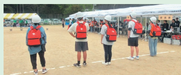
▲防災リュックを背負って走る「防災リレー」の様子