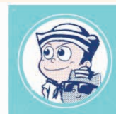
▲ストーリーに登場するキャラクター