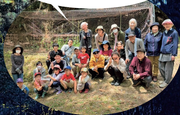
似島のホタル池で撮影