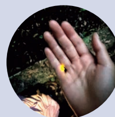
▲手のひらにホタルが!