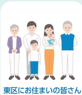
東区にお住まいの皆さん

お気軽にお声掛けください。 ☎地域支えあい課(☎568-7731、7735、7729、㊚568-7790)、地域起こし推進課(☎568-7704、㊚262-6986)