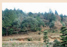
樹木を伐採して、身を隠す場所を減らす