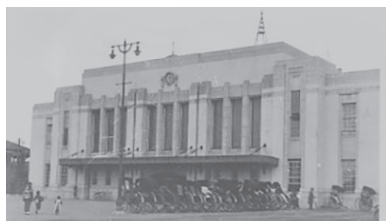
戦前の広島駅(駅舎)

4月からエールエールHIROSHIMAに移転・開館した3施設。オープンを記念して、広島駅に関するイベントを開催します。この他にも、年間を通じてさまざまな催しを企画しています。