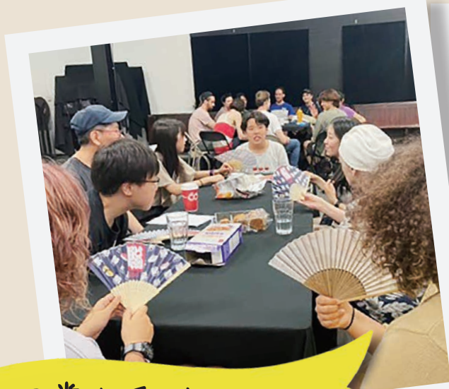
日常を飛び出して