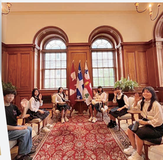
モントリオール市庁舎や領事館など普段は入れないような施設を訪問