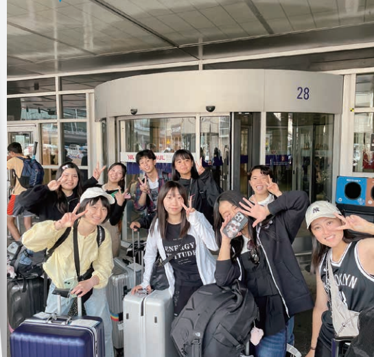
クラスメイトやルームメイト、他校の参加者とも絆が深まりました!