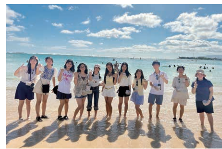
ホノルル市留学の様子(令和7年度実施)

【留学先】モントリオール市 【留学期間】7月25日(土)～8月8日(土) 【派遣生徒数(費用補助対象者)】12人 【自己負担金】29万8000円 【申し込み】直接か郵送で、「出願書」「校長推薦書」「小論文」を、5月7日(木)必着までに、教育委員会指導第二課(〒730-8586 中区国泰寺町一丁目7-40 APエールテラス国泰寺ビル3階)へ 【選考日】5月17日(日)予定