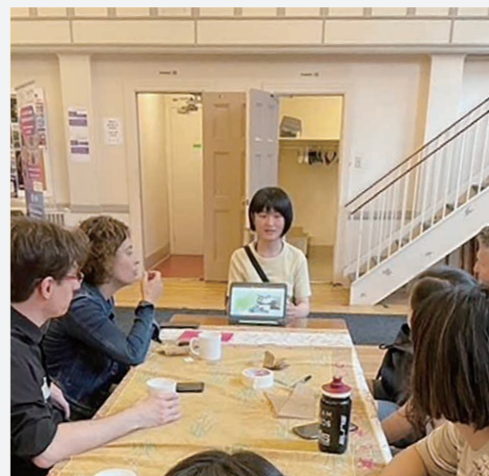
一人一人が何度も練習を重ね、平和への思いを英語で発表