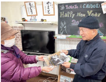
▲グッズの収益は全て、同会の運営に使っています

また、地域のさまざまな団体とも協力して取り組み、活動を通して地域内での人の交流を生み出しています。