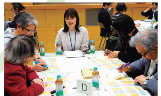
▲袋町地区の特長についてアイデアを出し合う様子

袋町地区では地域団体と企業が一体となって「ひろしまLMO」の設立に向けて取り組んでいます