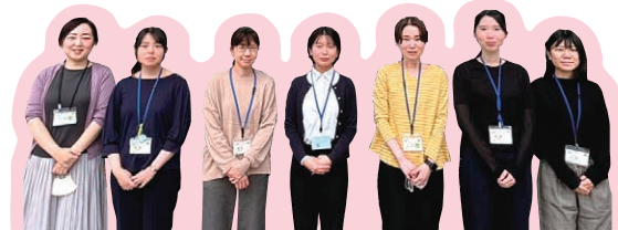
▲区の地区担当保健師