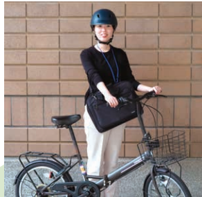
▲家庭訪問に向かう保健師