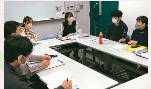
▲多機関との協議の様子

はちまるごーまる 高齢の親が子を支える8050問題など、困り事が複雑になった場合は、地域包括支援センターや区障害者基幹相談支援センターなど、さまざまな機関の人と連携し、解決に向けて支援します。