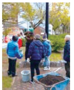
▲猿猴川沿いの桜並木を手入れの様子