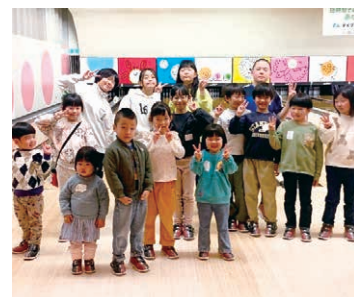
▲子ども会での親睦活動(ボウリング大会)の様子