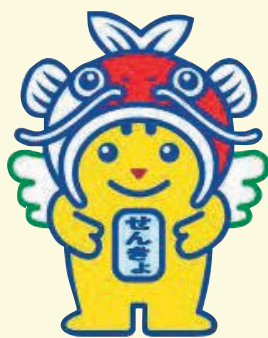
明るい選挙イメージキャラクター 「めいすいくん」

小選挙区の再編成により、安芸区の衆議院議員小選挙区の区割りは第4区から第3区へ改定されました。次回の衆議院議員総選挙から適用されます。投票の際はご注意ください。 区選挙管理委員会事務局 (☎821-4903、㊚822-8069)