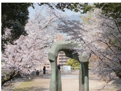
▲ムーアの広場。彫刻家:ヘンリー・ムーア氏の作品「アーチ」と桜を楽しむ

桜とアート作品を一体的に楽しむのは同園ならではの楽しみ方です。屋外設置の芸術作品を鑑賞したり、富士見台展望台(メイン写真)からは市街地を見渡したり。ちょっと足を止めて眺めてみてはいかがでしょうか。