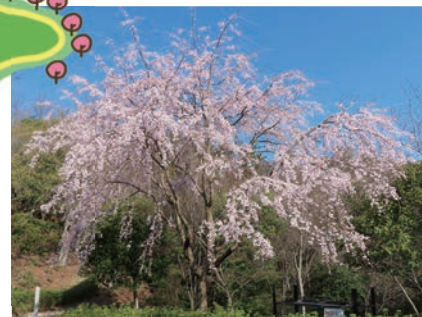
▲芝生広場と中央広場で見られる、ヒトエシロヒガンシダレザクラ

森林公園(東区) 開園時間 9:00~16:30(入園16:00まで) 普通車450円 岡東区 ☎899-8241、☎899-8491 休(水)(3月27日、4月3日は除く)