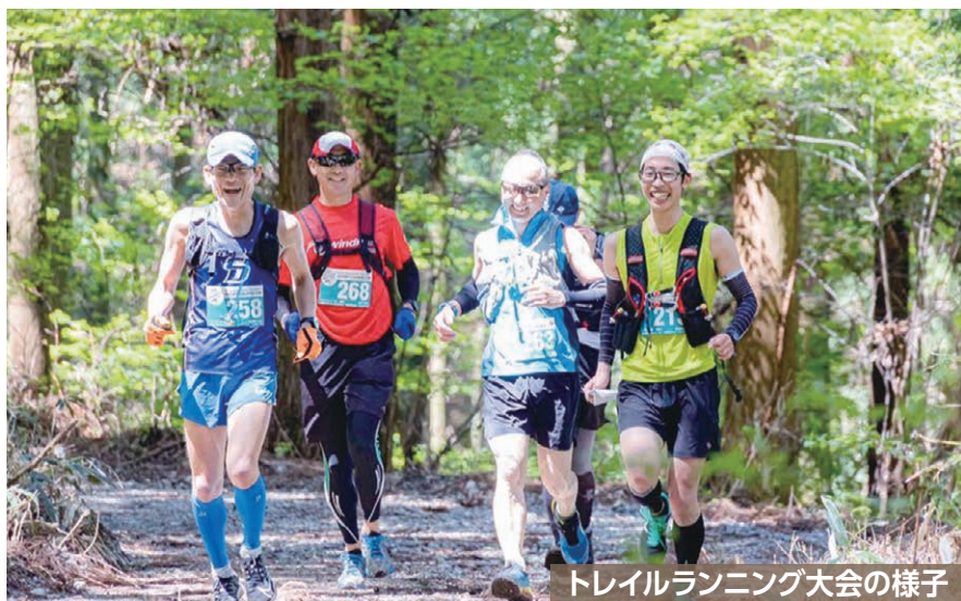
トレイルランニング大会の様子