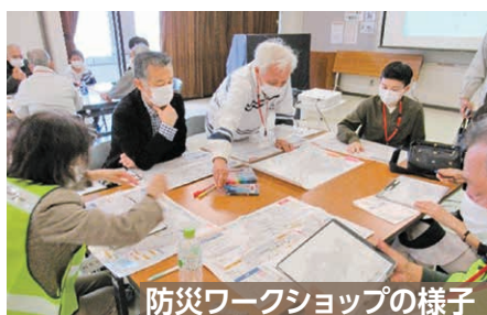
防災ワークショップの様子

美鈴が丘まちづくり協議会は、防災研修会・ワークショップなどを開催し、危険な地域や課題の共有や、災害時における適切な住民の行動についての検討を行っています。検討した内容を基に、現在、補助金を活用して写真やイラストなどを使用した美