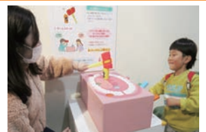
▲ゲーム「むし歯菌をやっつけろ!」

日3月10日(日)まで 場健康科学館 内パネル展示や体験ゲームなどで、歯と口の大切な働きを楽しく学ぶ ¥観覧料:370円、高校生*・シニア180円 問☎246-9100、☎246-9109 休(月)(1月8日は除く)、12月28日～1月4日、9日、10日