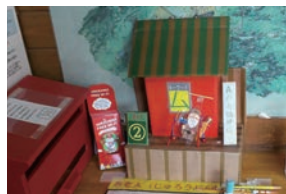
▲②七福神の展示(一例)

■①開運! 虫みくじ、②森の七福神めぐり 日1月6日(土)～8日(祝)の①9:00～16:00、②10:00～14:00 内①昆虫のかわいいイラスト付き虫みくじを引いて新年の運勢を占う、②同園を巡って七福神探し。参加者には記念品を進呈 駐普通車450円 申①②当日会場で。先着各日①200人、②100人