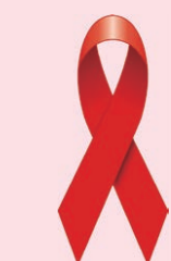
レッドリボンは、エイズへの理解と支援の象徴です

現在は、早期発見・治療により、エイズの発症を抑えることや、発症しても進行を防ぐことができます。