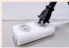
差し込みが緩いコンセント