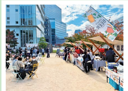
昨年のカラフルマルシェの様子