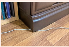
家具の下敷きになった電気コード