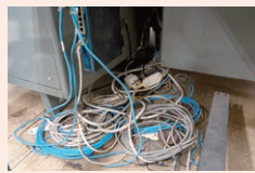
ほこりまみれの電気コード