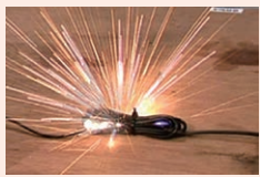
束ねた電気コード