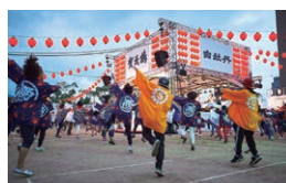
昨年のメイン会場