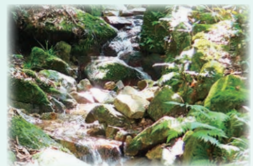
ゆうみょう 幽明の滝

境内では三滝寺の由来となる水源の異なる3つの滝(右写真)の音が響き、青々とした緑と爽やかな風を楽しみながら、境内を散策することができます。