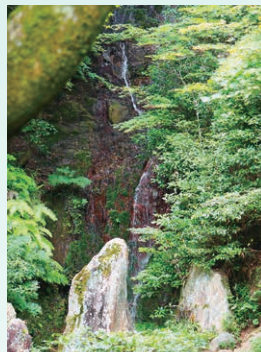
ぼんおん 梵音の滝