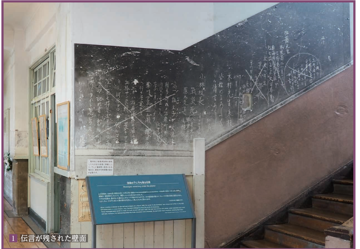
1 伝言が残された壁面