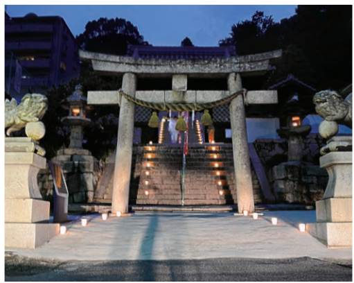
尾長天満宮(5) 【催し/時間】おりづるを折ろう/9:00~12:00 尺八演奏/19:30~