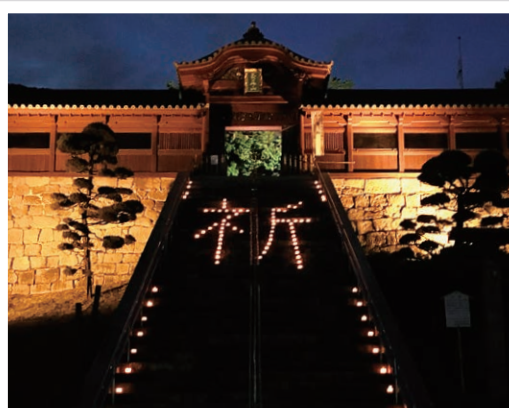
広島東照宮(4) 【催し/時間】笙の演奏と原爆の話/18:45~