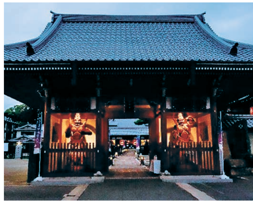
明星院(2) 夜間拝観とライトアップ