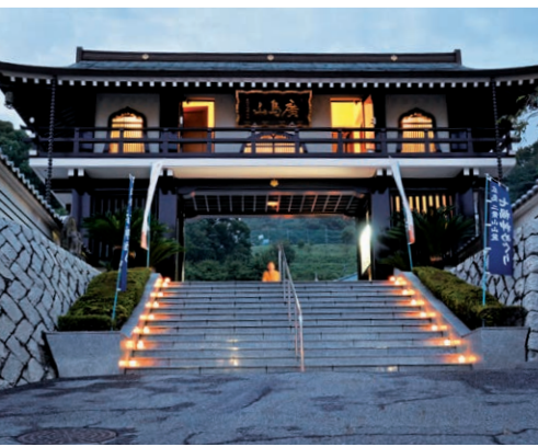
聖光寺(7) 【催し/時間】虚無僧による尺八の演奏/ 20:00~