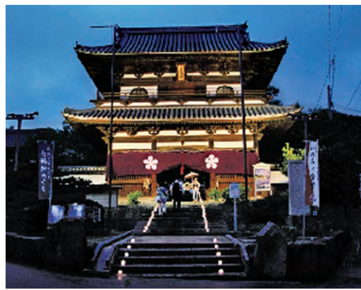
國前寺(6) 【催し/時間】読経/19:45~