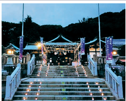
鶴羽根神社(3) 【催し/時間】鎮魂のろうそく献灯(先着50人) /19:00~

エキキタにある七つの社寺で、原爆犠牲者の供養と平和を祈念する「夏の夜、祈りと平和の夕べ」を開催します。灯りに包まれた社寺を訪れてみませんか。 園地域起こし推進課 (☎568-7704、㊚262-6986)