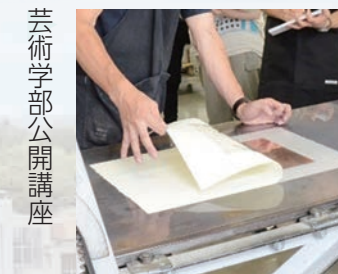
芸術学部公開講座