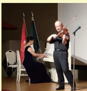
30周年の「ハノーバーの日」ドイツ音楽コンサートの様子