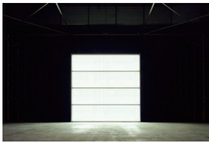
《The Sound of Silence》2006