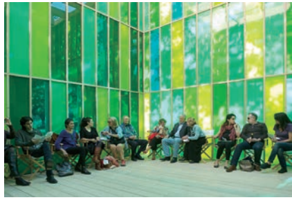
《Music (Everything I know I learned the day my son was born)》2013

ヒロシマ賞は、核兵器廃絶と世界恒久平和を願う「ヒロシマの心」を美術を通して世界へアピールすることを目的とし、市が1989年に創設しました。3年に一度、美術の分野で人類の平和に貢献した作家に授与しています。