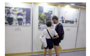
終了後の会場見学の様子