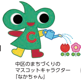
中区のまちづくりの マスコットキャラクター 「なかちゃん」