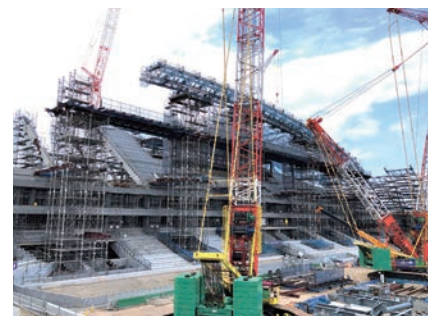
3月22日時点のメインスタンド側の工事状況