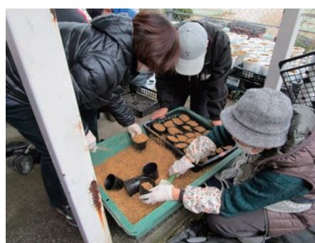
写真上:種まき 同右上:船越小学校への出張講座 下:船越中学校での植え替え作業