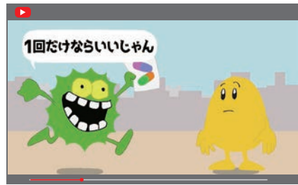
市公式YouTubeチャンネルで啓発動画を配信しています

薬物の乱用は脳にダメージを与え、記憶障害、感情のコントロールが利かないなどさまざまな障害を引き起こします。特に、成長期にある青少年の脳は成人に比べて影響を受けやすいため、注意が必要です。また、依存性により、やめたいと思ってもやめられなくなります。