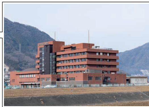
【所在地】安佐北区可部南二丁目1-38