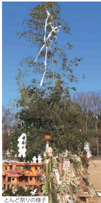
とんど祭りの様子