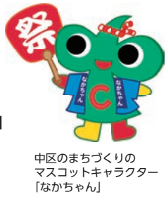
中区のまちづくりの マスコットキャラクター 「なかちゃん」