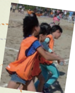
△ ふれあいスポーツ大会

今年の1月、3年ぶりとんど祭りを開催しました。準備には100人ほどの町民が参加し、役割分担しながら大小二つのとんどを作りました。当日は、ミニゲームコーナーやお餅の振る舞いなどもあり、大盛況でした。他にも、夏祭りやふれあいスポーツ大会などの行事を開催しており、町民の交流の場の一つとなっています。