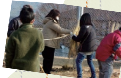
△ とんど祭りの準備の様子