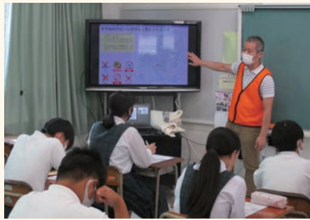
早稲田中学校(東区)

学校運営協議会と協議しながら、「地域の自然・歴史」「伝統文化」「キャリア教育」の三つのテーマの中から地域人材などを活用した取り組みを行っています。