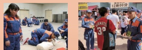
救命講習 広報活動