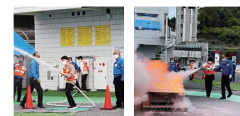
放水訓練 消火訓練

研修を受け、災害に対する心構えや必要な知識を身に付けることができました。もし災害が起きた場合にはこの経験を生かして行動し、周りの人の役に立ちたいです。