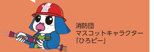
消防団 マスコットキャラクター 「ひろぴー」