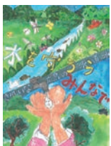
市長賞(図画・ポスターコンクール)

内「水・水道」をテーマに描いた図画・ポスターや、「清らかな水源、大切な水、身近でおいしい水道水」をテーマに撮影した写真の入賞作品展