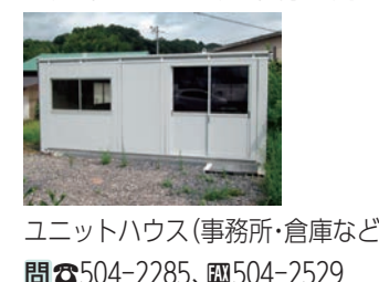
ユニットハウス(事務所・倉庫など) 問☎504-2285、☎504-2529