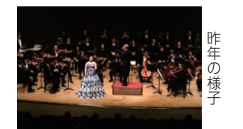
昨年の様子 日12月7日(水)18:30~20:30 場JMSアステールプラザ 内市新人演奏会で優秀演奏者に選ばれた市ゆかりの若手演奏家4人と広島交響楽団の共演。詳しくは文化財団HPで

¥一般2,500(当日3,000)円、小・中・高校生*1,500(当日1,800)円。チケットは各区民文化センター(安佐北区は除く)などで 問同財団企画事業課(☎244-0750、☎245-0246)