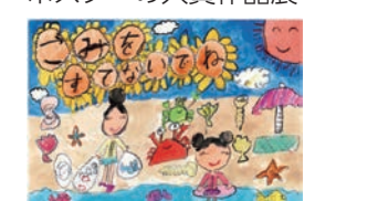
令和3年度市長賞(小学校1年生の部) 問業務第一課(☎504-2098、☎504-2229)

内「広島のみちをきれいにすること」や「ボランティア清掃に関すること」をテーマに描いたポスターの入賞作品展