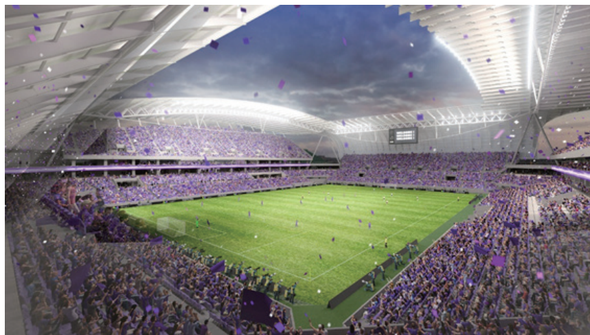
サッカースタジアムのイメージ図 ※今後、設計などにより内容が変更となる場合があります