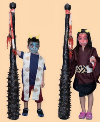
▲鬼に扮した地域の子どもたち