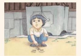
「太陽をなくした日」の一場面

申 所定の申込書が平和文化センターホームページで、9月29日(木)(必着)までに、同センター平和市民連帯課へ。申込書は、同課、区役所、公民館などで。抽選50人 岡☎242-8872、☎242-7452