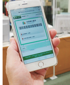
貸出利用券を忘れても、スマホ画面にバーコードを表示して貸出し手続きが可能