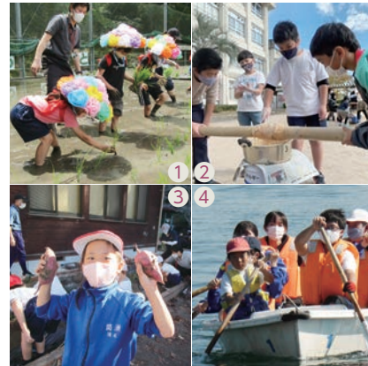
年間行事の例 ①米作り、②バウムクーヘン作り、③芋掘り、④ローボート体験 など

「いきいき体験オープンスクール校」とは、恵まれた自然環境を生かした体験活動を通して、自然を愛する心や他人を思いやる心などを育む学校のことです。現在、安佐北区の筒瀬小学校と南区の似島小中一貫教育校が同スクール校として児童生徒を募集しています。体験活動に加え、児童生徒数が少ない小規模校の特性を生かし、きめ細かな指導で、確かな学力の向上に努めています。