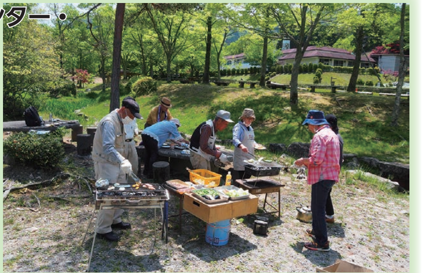
例年、初夏の時期にバーベキューをして親睦を深めているグループ。「新緑の中でカーブのラジオを聞きながらみんなでワイワイするのが楽しい」

夜になると漆黒の闇に包まれ、天気の良い日は星がきれいに見えます。子どもの頃、学校行事で訪れた日を懐かしんで再訪する人も多そうです。緑豊かな環境の中、おいしい空気を吸いながらゆったりとした時間を過ごしませんか。自然を満喫できる当施設へ、ぜひお越しください。山の上でお待ちしています。