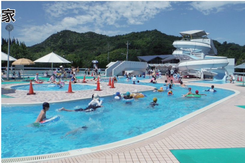
迫力満点のウォータースライダーなどもある海水プール

海や山での自然体験活動ができる宿泊施設です。夏場は特に魅力満載！海水プールは、地下約30mの地下水を使用していて、おおむね海水の半分程度の塩分が含まれています。そのため、水の透明度が高いのが特徴です。ここならではのプールをお楽しみください。