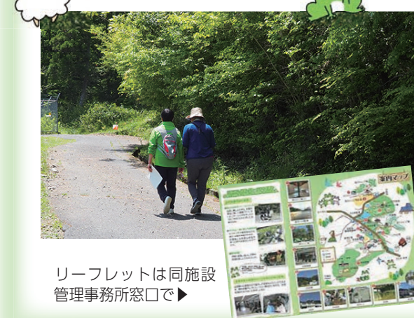
リーフレットは同施設管理事務所窓口で▶