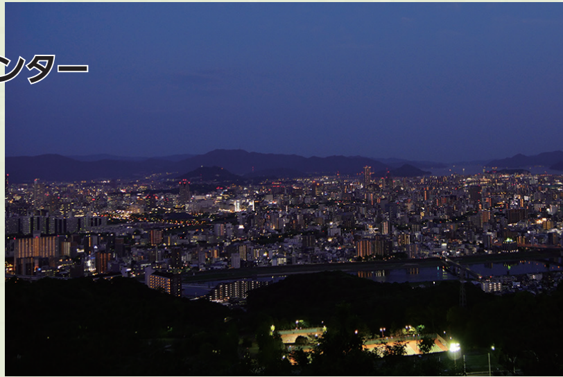
展望台から見る市内の夜景(5月17日午後7時半頃撮影)