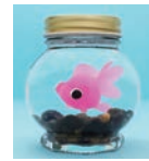
金魚のアクアボトル