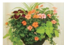
夏の草花のバスケット

日6月16日(木)10:00~12:00 場中央公園ファミリープール ¥2,500円 申往復はがきで、必要事項(6頁左)を、5月31日(火)(必着)までに、みどり生きもの協会(〒730-0011 中区基町4-41)へ。抽選12人 問☎228-0815、☎228-1891