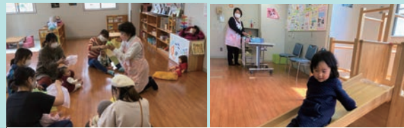
キッズひろばみなみ

おもちゃや絵本などが揃っていて、楽しく自由に過ごせ、情報交換もできます。予約制が多いので申し込みなどは各常設オープンスペースのホームページをご確認ください。