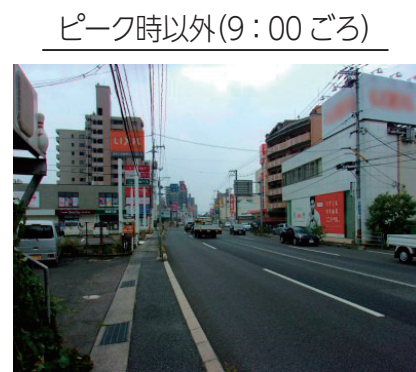
ピーク時以外(9:00ごろ)