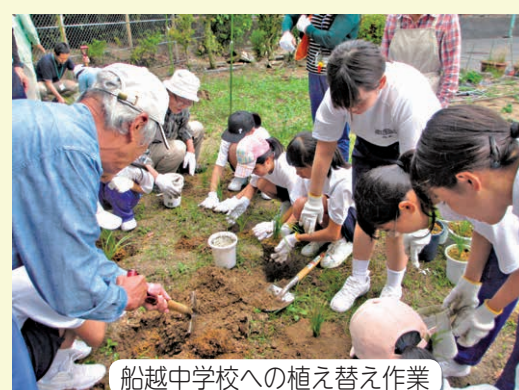
船越中学校への植え替え作業

誰故草を育てている人、興味のある人、私たちと一緒に活動しませんか？ 随時、入会を受け付けています。船越公民館までご連絡ください。